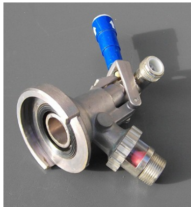
KEG – Zapfkopf Flachfitting