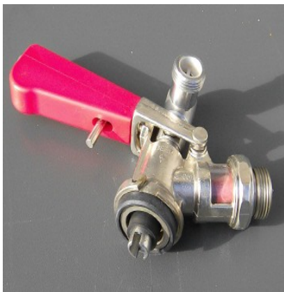
KEG – Zapfkopf Korbfitting

Mietpreis langes Wochenende 24 € plus Kohlensäure 19 €