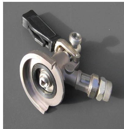
KEG – Zapfkopf Kombifitting